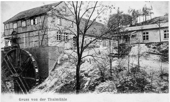
Gruss von der Thalmühle